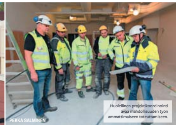
Huolellinen projekti- ja työsuunnittelu ei ole mahdollisuuden työn ammattimaiseen toteuttamiseen.